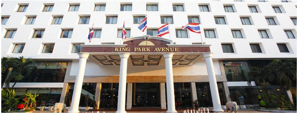
ด้านหน้าโรงแรมคิงปาร์คเอเวนิว กรุงเทพฯ