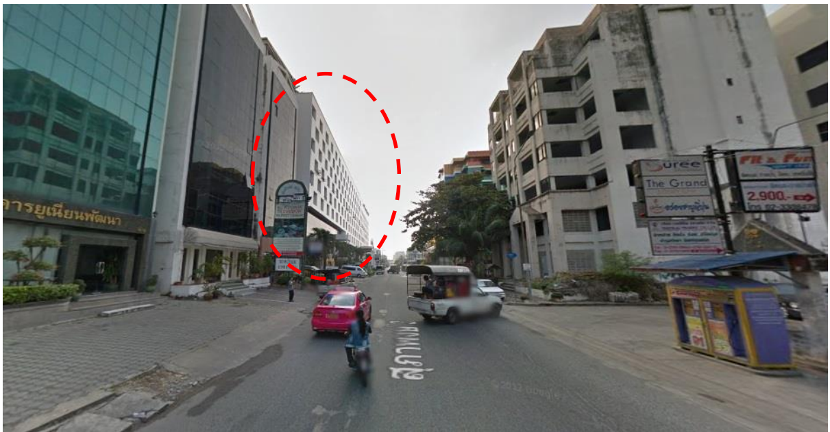
ตรงมาจะเห็นตัวโรงแรมคิงพาร์คเอเวนิวอยู่ทางซ้ายมือ