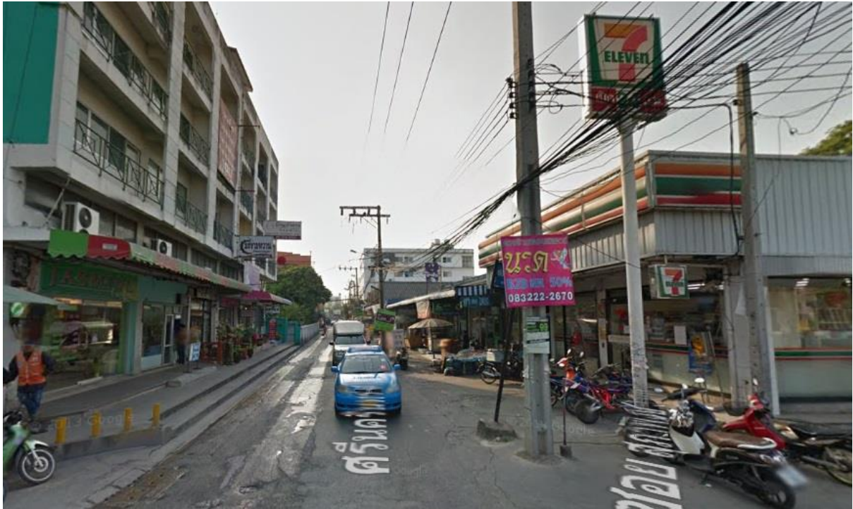
เข้ามาในซอยจะเจอร้าน 7 eleven ทางขวามือ