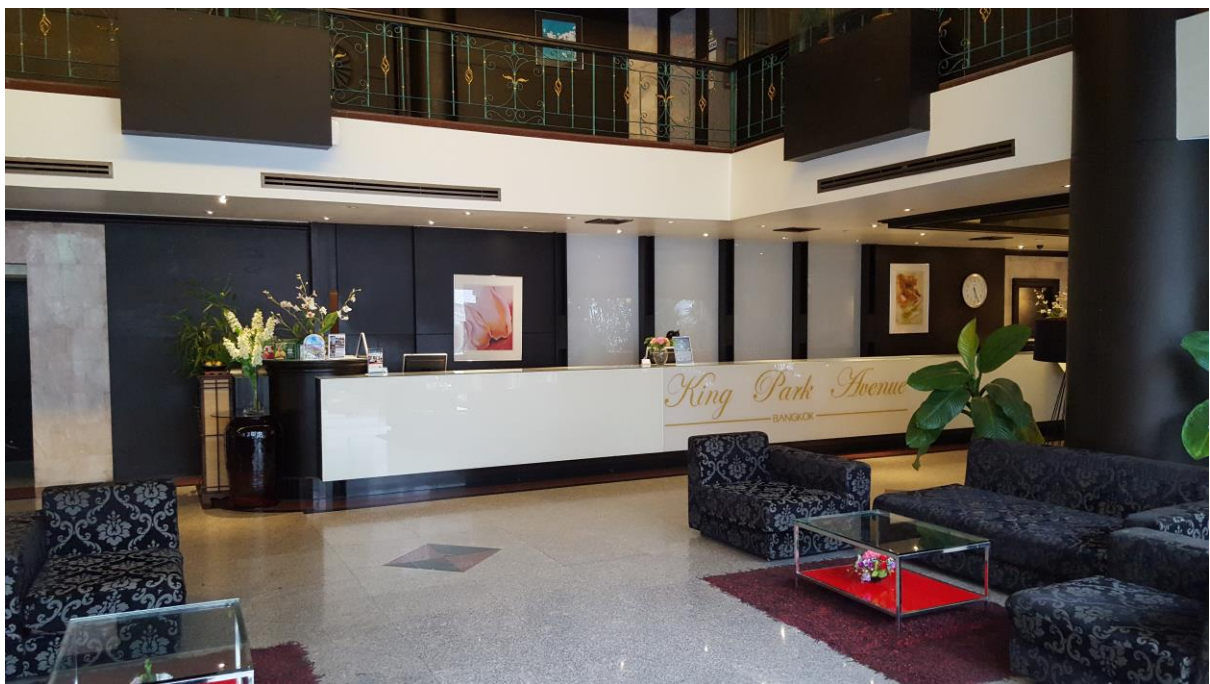
เดินเข้าประตูด้านหน้ามาจะเจอ counter ประชาสัมพันธ์ของโรงแรม