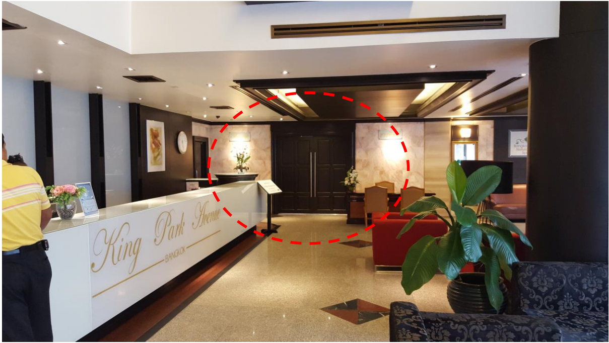
มองทางด้านขวาจะเห็นห้องอาหารทิพย์อยู่ด้านหน้า