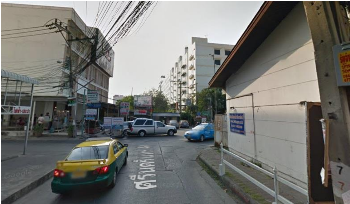
ตรงเข้ามาสุดซอยจะเจอ 3 แยก