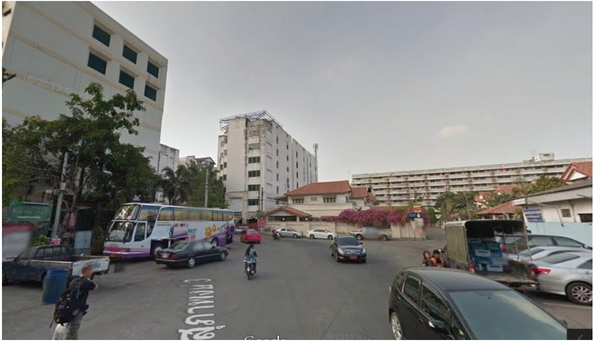
ให้เลี้ยวขวาไปตามทาง